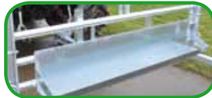
Futtertrog ( auf Wunsch )