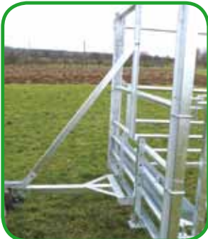
Deichsel ( Serie )