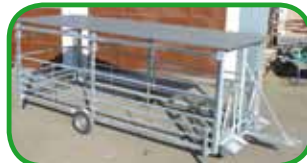
mit Trapezblech ( auf Wunsch )