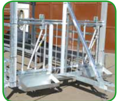
Fressgitter mit Trog ( auf Wunsch )