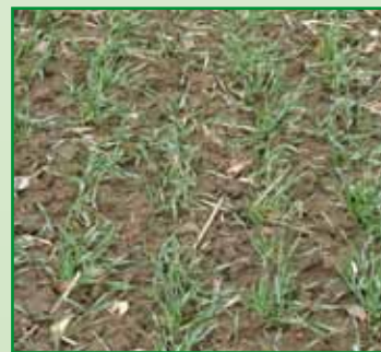
Reihensaat mit Variozinken

Reihensaat mit Variozinken auf 12,5 cm Reihenabstand.