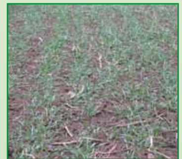
Bandsaat mit Großfederzinken

Bandsaat auf 15 cm Reihenabstand mit einer Bandbreite von ca. 6 cm